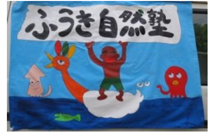
この旗が目印です

東京駅八重洲中央口 改札の外にお越しください。 下の地図の ライオンが目印のコインロッカー前 当日わかりにくい場合は、八重洲中央口改札外までお越しいただき、 そこからお電話ください。090-1425-2694